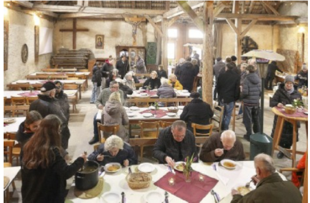
Die Suppe schmeckt allen

Der Suppentag in unserer Pfarre ist ein gelebtes Zeichen der Solidarität und Nächstenliebe. Besonders in der Fastenzeit laden wir ein, gemeinsam innezuhalten, ein einfaches Mahl zu teilen – eine schmackhafte Suppe – und dabei den Blick über den eigenen Tellerrand hinaus zu richten. Der Sinn dahinter ist: Statt aufwändig zu essen, spenden wir den eingesparten Betrag für Menschen in Not.