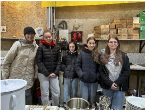
Das fleißige Betreuersteam

Diese Tradition hat tiefe christliche Wurzeln. Schon in der frühen Kirche war das Fasten nicht nur eine spirituelle Übung, sondern auch Ausdruck konkreter Hilfe. In Ulrichskirchen führen wir diesen Gedanken bewusst fort. Seit vielen Jahren wird unser Suppentag von engagierten Pfarrmitgliedern organisiert – besonders auch von den jugendlichen Firmkandidaten – und mit viel Herz und Gemeinschaftsgeist gestaltet.